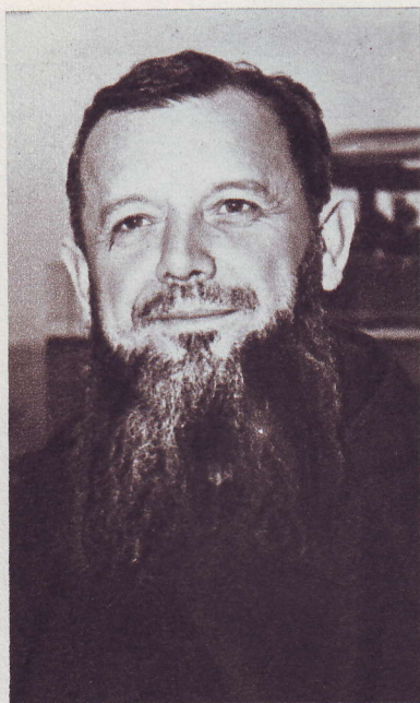
Min. Prov. p. Guglielmo da Corlo