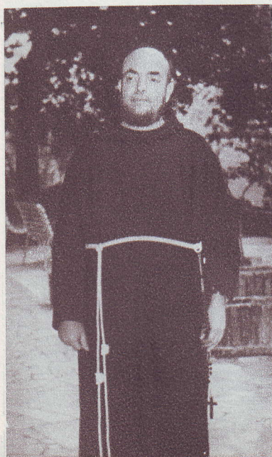
Min. Prov. p. Basilio da Baggio