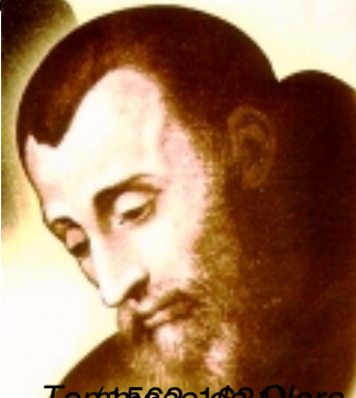
Tommaso da Celano