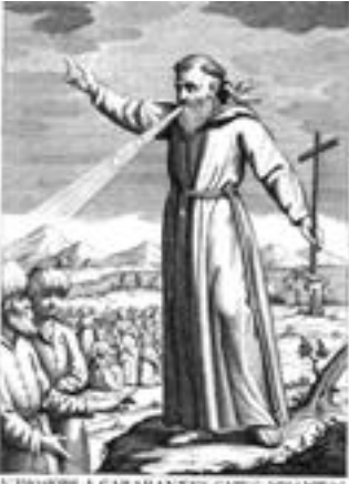
Giuseppe Velasco da Carabantes