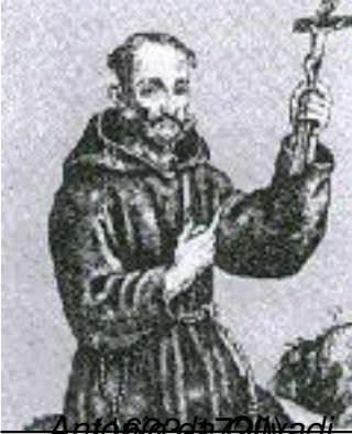
Antonio da Padova