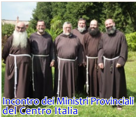
Incontro dei Ministri Provinciali del Centro Italia

25 SETTEMBRE 2010 "SAN FRANCESCO E IL SULTANO" presso il Convento di S.Francesco a Firenze. Tutta una giornata dedicata allo studio e all'approfondimento storico e profetico di uno dei più straordinari gesti di pace nella storia del dialogo tra Islam e Cristianesimo. In collaborazione con la Pontificia Università ANTONIANUM di Roma, sono sei gli specialisti invitati ad esporre un tema, con degli aspetti e risvolti così attuali. L'occasione è propizia per una tappa di Formazione Permanente per tutta la Famiglia Francescana.