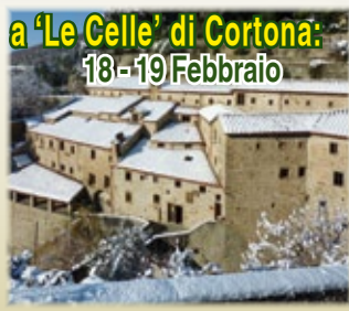
a 'Le Celle' di Cortona: 18-19 Febbraio

In questo cammino spirituale vivremo insieme le tre dimensioni fondamentali della vita cristiana: l'ascolto della Parola di Gesù; la preghiera della Chiesa e la condivisione fraterna.