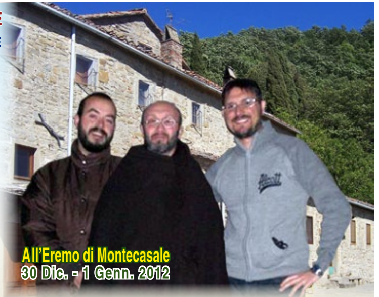
All'Eremo di Montecasale 30 Dic. - 1 Genn. 2012

6 Settimane per adolescenti e giovani "SUL CAMMINO DELL'AMORE" ; 5° appuntamento: 18 - 19 Febbraio sul tema: "Il corpo, mezzo espressivo dell'amore" . È riservato a tutti, ragazzi e giovani (anche non fidanzati) tra i 16 e i 30 anni.