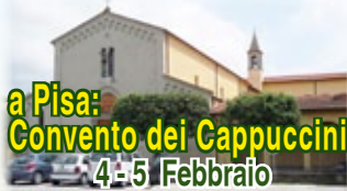
a Pisa: Convento dei Cappuccini 4-5 Febbraio

La proposta è offerta a giovani dai 18 ai 35 anni che desiderano ascoltare la voce di Dio per vivere la propria vita sui passi di Francesco d'Assisi , nel matrimonio come nella vita religiosa e sacerdotale. Attraverso una serie di week-end e all'interno di una comunità francescana, faremo risuonare dentro di noi la domanda di Francesco: "Signore, cosa vuoi che io faccia?" .